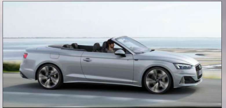
Audi A5 er luksuriøs, men til at betale for de fleste.