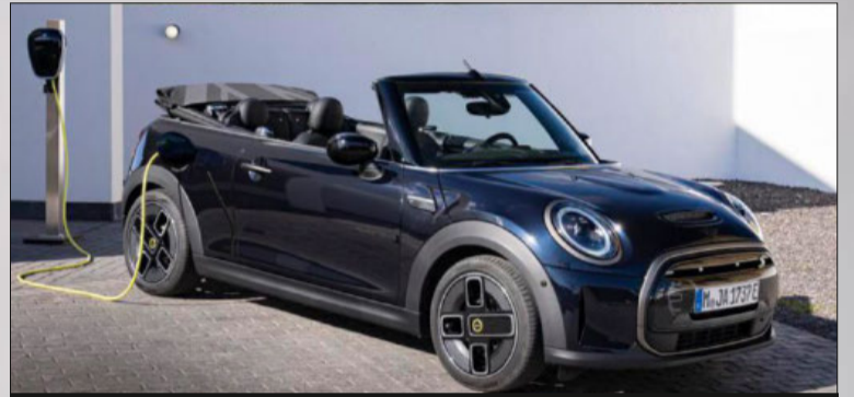
Vil man være den moderne Mr. Bean, er Cooperen vejen frem.

af britisk arrogance, er det faktisk en japansk bil. Den er holdbar, pålidelig og nok også en anelse egocentrisk, for der er ikke plads til meget andet i bilen end en selv, siger han og fortsætter: